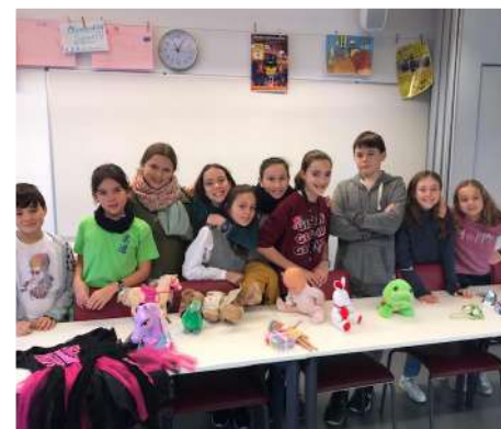
Troc de Noël