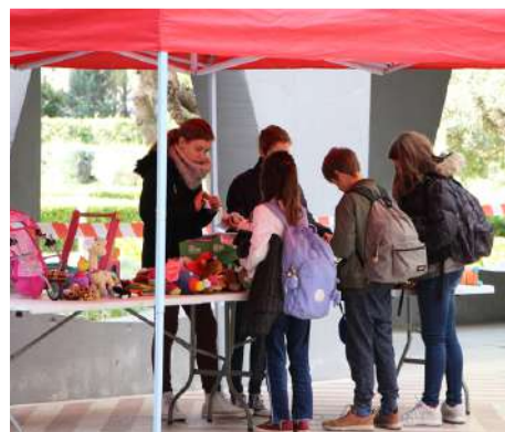
Troc de Noël