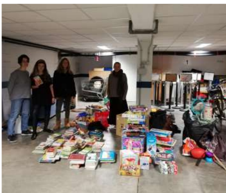
Calendrier de l'avent solidaire